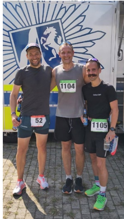
Das diesjährige Team der HSPV NRW