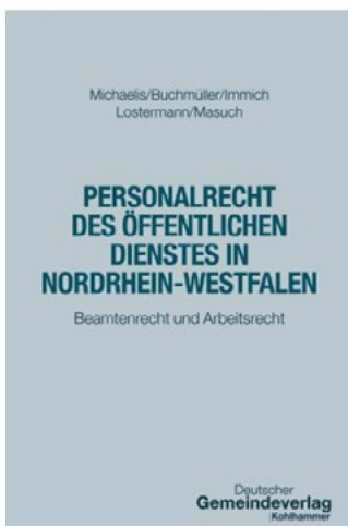
Buchcover (Bild: Kohlhammer-Verlag)

Neues Lehr- und Fachbuch zum Personalrecht erschienen