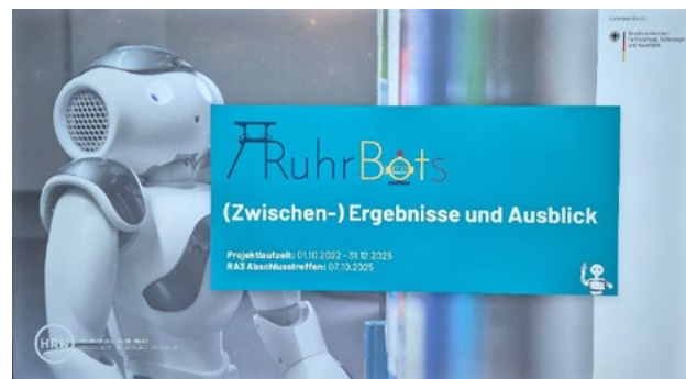
Chart der RuhrBots-Präsentation