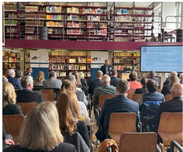
Vortrag zum Alimentationsprinzip