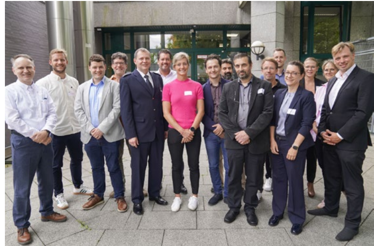
Die neuen hauptamtlich Lehrenden wurden in der Zentralverwaltung der HSPV NRW begrüßt

Das neue Format wurde von den Teilnehmenden sehr positiv aufgenommen. Insgesamt bot die Veranstaltung einen gelungenen Auftakt und erleichterte den Einstieg der Lehrenden in ihre Tätigkeit an der Hochschule.