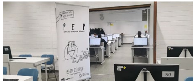
Das Elektronische Prüfungszentrum der Universität zu Köln

Die Einsatzmöglichkeit des neuen Tools sind vielfältig: PEP hat Studierenden der HSPV NRW die testweise Nutzung des