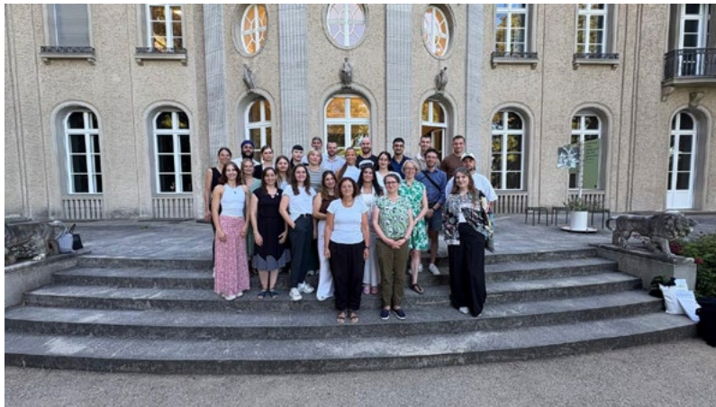
Die Studiengruppe vor dem Haus der Wannsee-Konferenz