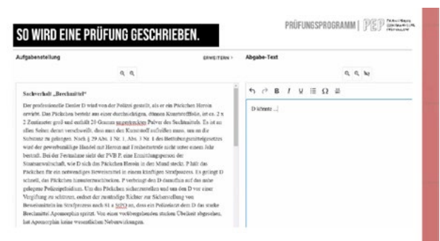
EDUTIEK-Oberfläche bei der Prüfungsdurchführung

Tools ermöglicht und unterschiedliche Prüfungsszenarien mit der Langtext-Aufgabe durchgeführt. Das ILIAS-Plug-In lässt sich sowohl für einzelne Selbststudiumsaufgaben wie auch für semesterbegleitend angelegte formative Prüfungen (Learning Assessments und Long Term Assessments) einsetzen. Es funktioniert während der Online-Lehre von zu Hause aus und in den Räumen der HSPV NRW (Onsite- und Remote-Exams).