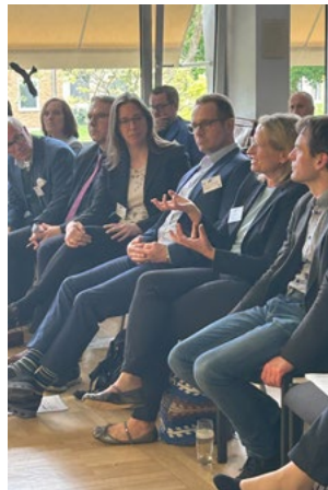
Austausch mit den Teilnehmenden