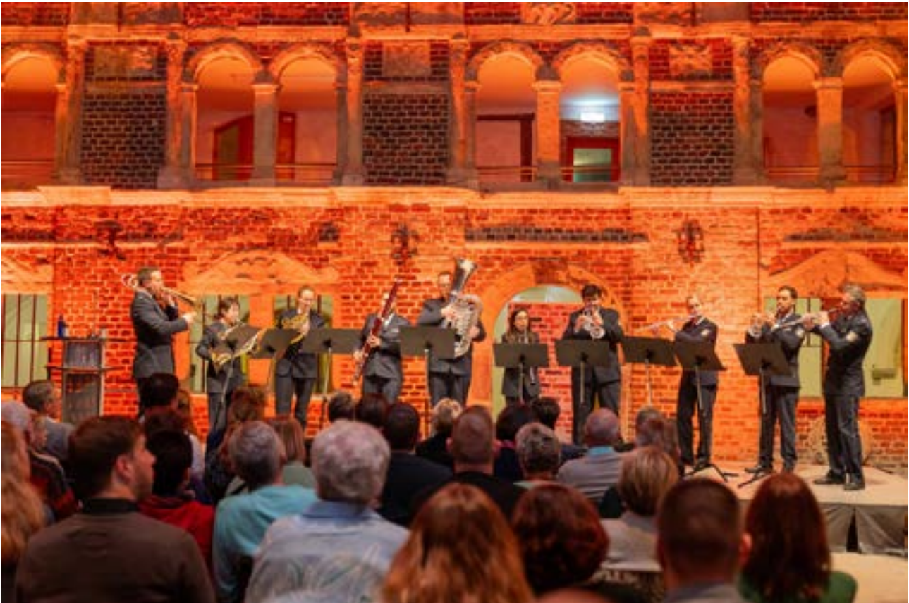
Das LPO beim Benefizkonzert 2024

Die HPSV NRW lädt am 9. November 2025 zum Benefizkonzert mit dem Landespolizei Orchester (LPO) ein. Wie bereits im letzten Jahr, wird die Veranstaltung erneut im Schloss Horst in Gelsenkirchen stattfinden, einem der bedeutendsten Renaissanceschlösser Westfalens. Der Minister des Innern des Landes NRW, Herbert Reul, unterstützt die Veranstaltung in Form einer Schirmherrschaft.