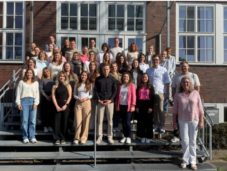
Studierende des aktuellen MPM-Jahrgangs in Bielefeld

Erfolgreicher Auftakt für den neuen Jahrgang des „Master of Public Management“ (MPM)