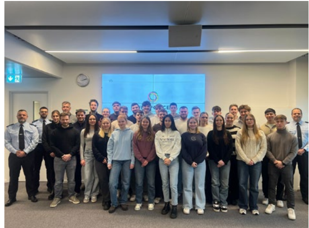
Zu Gast bei der luxemburgischen Polizei