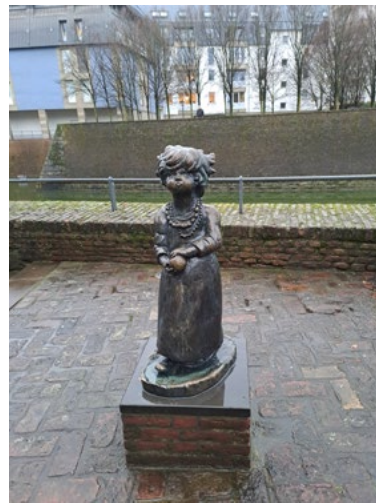
Das Mahnmal „Ehra“