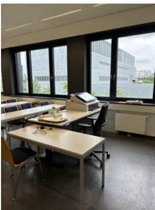
Medientechnik in einem Kursraum

Um den Umgang mit der Medientechnik in den Kursräumen an allen Studienorten der HSPV NRW zu erleichtern, wurden vom Mobilien Medienlabor und Medientechniker Florian Grigat umfassende Video-Tutorials erstellt, die ab sofort auf der Videoplattform VIMP zur Verfügung stehen. Die Videos erklären Schritt für Schritt die Bedienung der technischen Ausstattung und unterstützen Lehrende