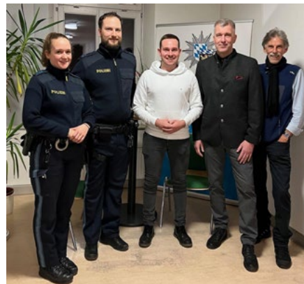
Besuch von IPA-Freunden aus NRW in Rosenheim