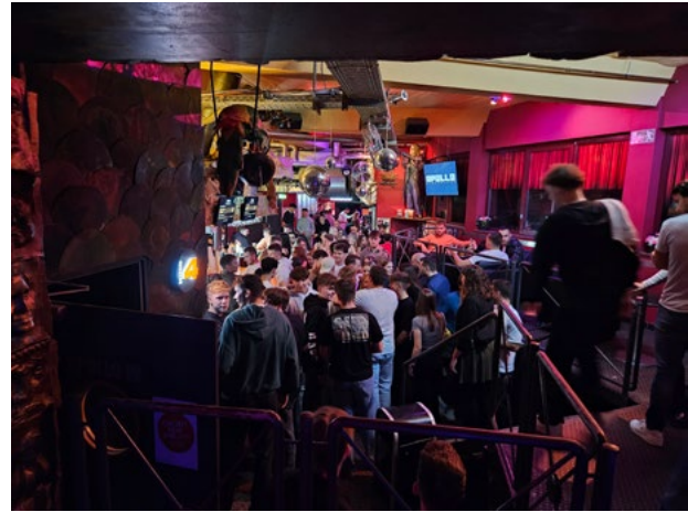
Feiern für den Zusammenhalt in der Aachener Diskothek „Apollo“