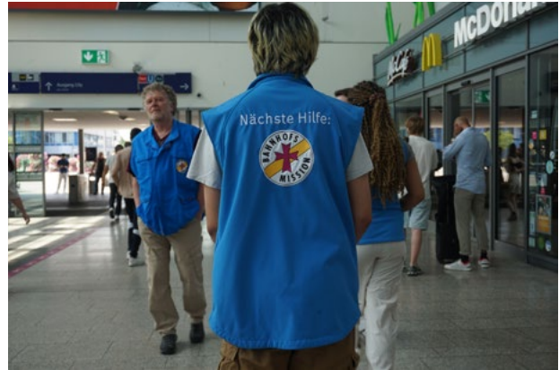
Der Studienort Duisburg sammelte bereits zum dritten Mal Spenden für die Bahnhofsmission