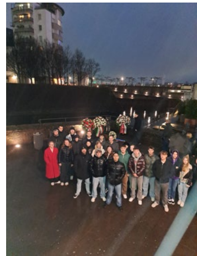
Polizeistudierende des Studienorts Hagen am Gedenkort

Die Gedenkstunde hat den Studierenden vor Augen geführt, wie wichtig eine Auseinandersetzung mit dem nationalsozialistischen Antiziganismus ist, um heutige Entwicklungen der Ausgrenzung und Diskriminierung dieser Menschen wahrzunehmen und zu bekämpfen.